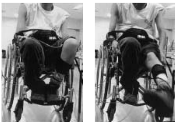
図1 クロウヌスおよび筋痙攣の出現風景

い刺激で容易にクロウヌスや筋痙攣を誘発しやすい方法を選択した。症例1では片側膝関節を伸展させる動作、症例2では片側足関節を背屈させる動作を行った。その際、対象者の自動運動による循環反応の影響をなくすため、関節運動による刺激はいずれも験者によって他動的に行ない、刺激を加えるのは短時間で筋収縮が得られた時点で刺激は中止した。